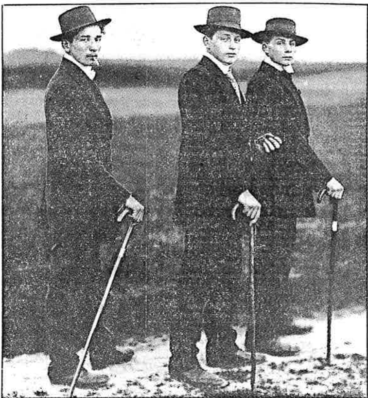
1914: Young farmers, Westerwald

traits have a tough, disturbing quality that influenced Diane Arbus's way of documenting the twins and freaks that have come to symbolize North America's underclass.